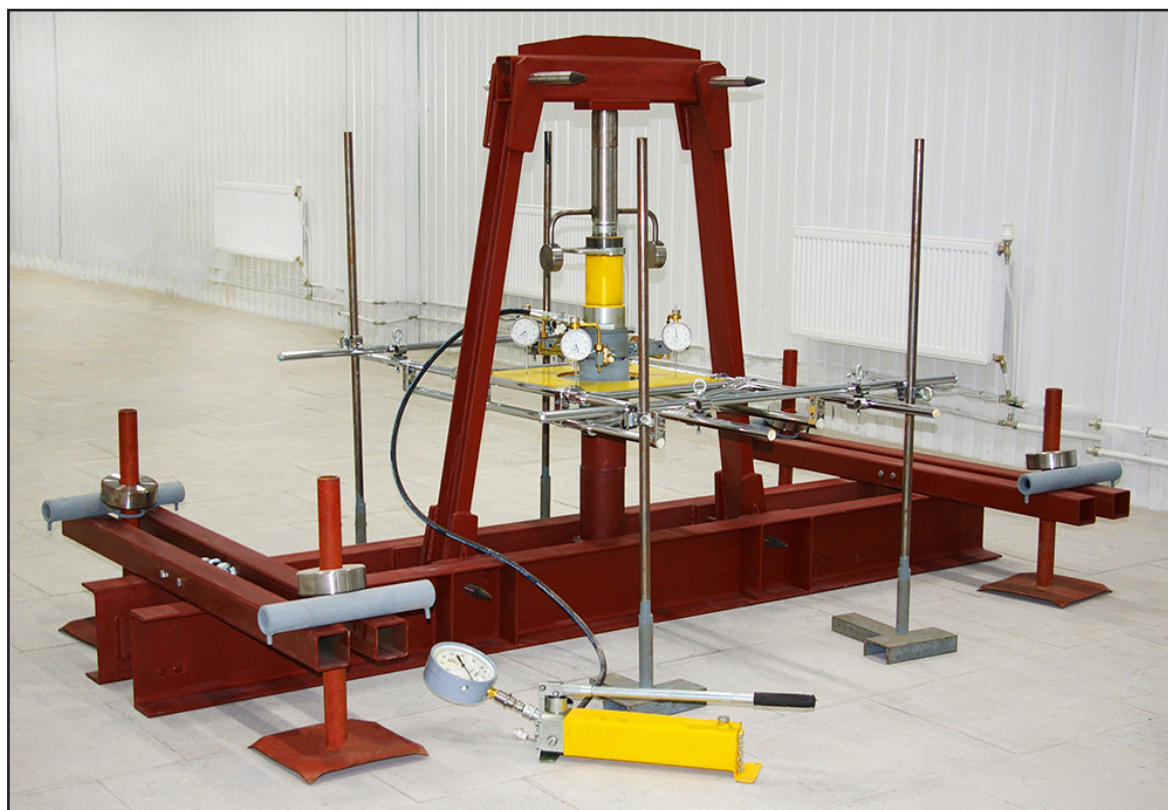
Рис.1. Общий вид штампа ШП20