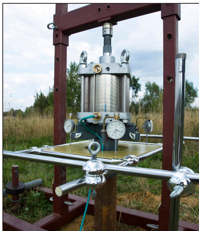
Рис.3. Позиционирование комплектующих штампа ШВ60

Результаты испытаний обрабатываются по программе ShwPW в соответствии с ГОСТ 20276.1-2020 и оформляются в виде Паспорта штампового опыта и Протокола штампового опыта.